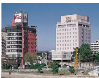
←松江ニューアーバン ホテル別館