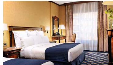
Marriott Hotel Milano

ミラノ中央駅に近くアクセスも便利なホテ ル。近年、室内が改装されて、フローリ ングに変わり全室スイートタイプで大きなデ スクがビジネスユーザーに好評。 宿泊者向けの無料Wi-Fi有り