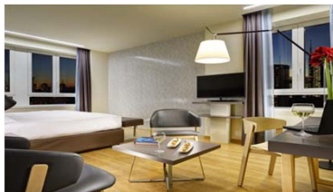
Una Hotel Century

ミラノ中央駅より徒歩3分ほど。エアコン付 きの客室52部屋、館内全域での無料Wi- Fiを提供しています。防音対策済みの客 室にはミニバー、薄型衛星テレビ、セーフ ティボックス、大理石の専用バスルーム が備わります。